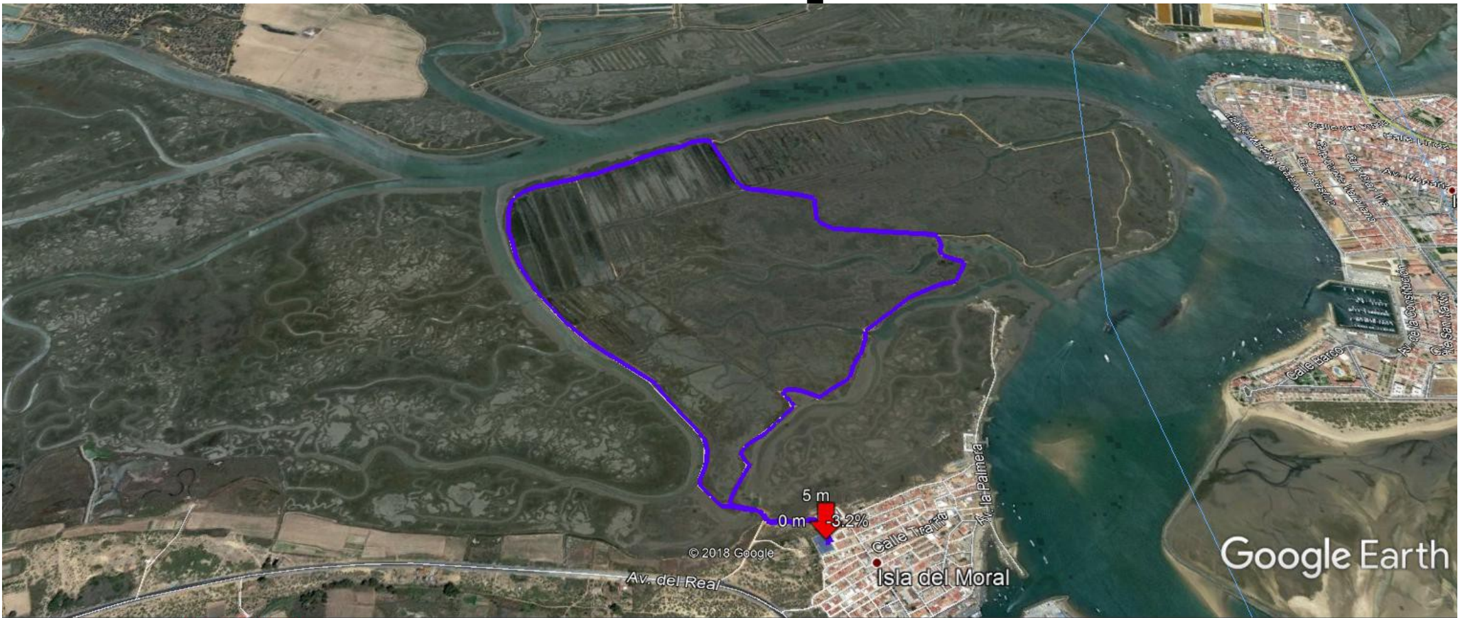
Gráfico: min., media, máx. Elevación: 1, 3, 5 m Total de intervalo: Distancia: 4.69 km Incremento/pérdida de elevación: 65.3 m, -65.3 m Pendiente máxima: 8.3%, -7.6% Pendiente media: 1.8%, -1.7%