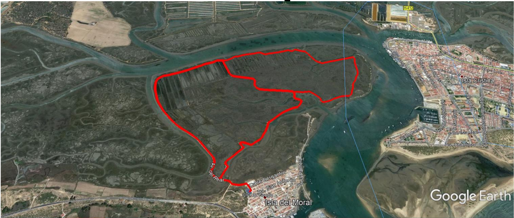
Gráfico: min., media, máx. Elevación: 1, 3, 4 m Total de intervalo: Distancia: 4.10 km Incremento/pérdida de elevación: 47.3 m, -46.9 m Pendiente máxima: 4.9%, -4.7% Pendiente media: 1.1%, -1.0%