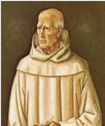
Gonzalo de Berceo (Berceo, Logroño, alrededor 1196 - Monasterio de San Millán de la Cogolla, hacia 1264)

Escritor medieval y primer poeta en lengua castellana con nombre conocido. Fue el primer representante del llamado “mester de clerecía” cuya principal aportación fue la difusión de la cultura latina.