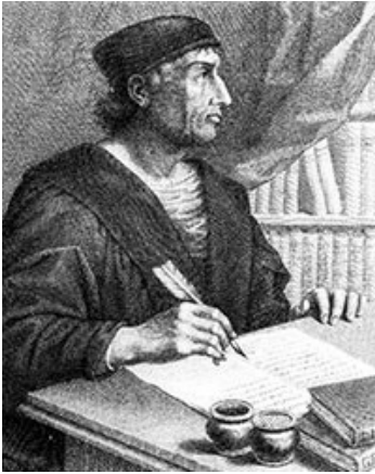
Elio Antonio de Nebrija (Lebrija, 1444- Alcalá de Henares, 2 de Julio de 1522)

Humanista, filólogo, latinista y principal introductor del Renacimiento italiano en la Península Ibérica. Ocupa un lugar destacado en la historia de la lengua española por ser el autor de la primera gramática en una lengua europea moderna y del primer diccionario.