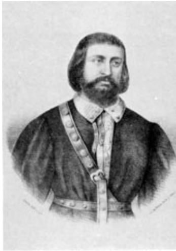
Pedro López de Ayala (Vitoria (Álava), 1332- Calahorra (La Rioja), 1407)

Escritor, político, diplomático, militar y figura destacada en la Península Ibérica en el siglo XIV y ejemplo del primer Renacimiento. Su vida abarca los reinados de seis reyes de Castilla: Alfonso XI, Pedro el Cruel, Enrique II, Juan I, Enrique III y Juan II y su nombre está indisolublemente ligado a las guerras y los conflictos civiles que caracterizan la historia castellana de ese período.