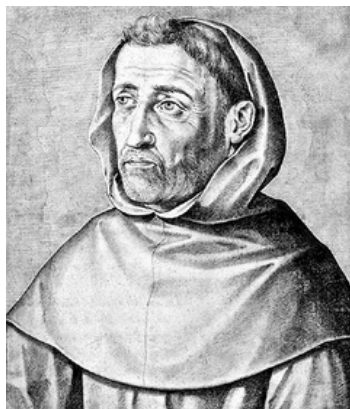
Fray Luis de Le n (Belmonte, Espa a, 1527 - Madrigal de las Altas Torres, id., 1591)

Escritor espa ol en lenguas castellana y latina, considerado el m ximo exponente de la literatura asc tica del Renacimiento y junto con San Juan de la Cruz, una de las principales figuras de la poes a religiosa del Siglo de Oro.