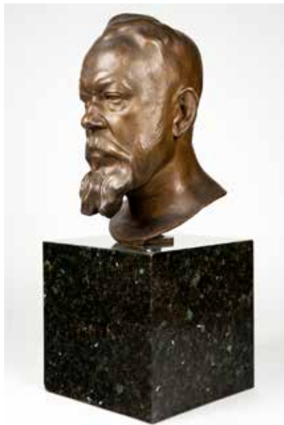
JOSÉ CAPUZ. "Busto de Joaquín. Sorolla"1918. Bronce. Museo Sorolla