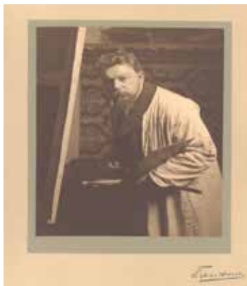
Christian Franzen. 1906.

Es consabido el hecho de que Joaquín Sorolla fue ya un pintor afamado y reconocido en vida, por lo que tuvo la oportunidad de ser fotografiado en múltiples ocasiones desde infinidad de objetivos y circunstancias. A continuación, sólo vamos a seleccionar algunas de aquellas fotografías de la más destacadas y que lo representan en actitudes distintas, pero que dan a conocer la complicitad que siempre tuvo con el que lo retrataba y no escatimaba en regalar la profundidad de su mirada o la grandilocuencia de su gesto, sin artificios ni vanagloria, ya que su simple presencia y su porte natural hacían que la cámara “conectara rápidamente con él”. En cierto modo podríamos compararlo con el gran Bernini, que como escultor y actor que fue, siempre supo preparar al espectador para la mejor lectura de su obra, y por ende de sí mismo.