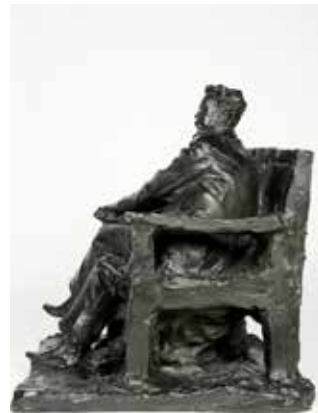
PÁVEL PETRÓVIVICH TROUBETSKOY (1866 – 1938). “Joaquín Sorolla y Bastida”. 1909. Museo Sorolla.