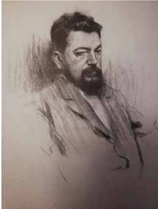
Ramón Casas y Carbó (1866 – 1932). Dibujo, retrato de Sorolla, 1904