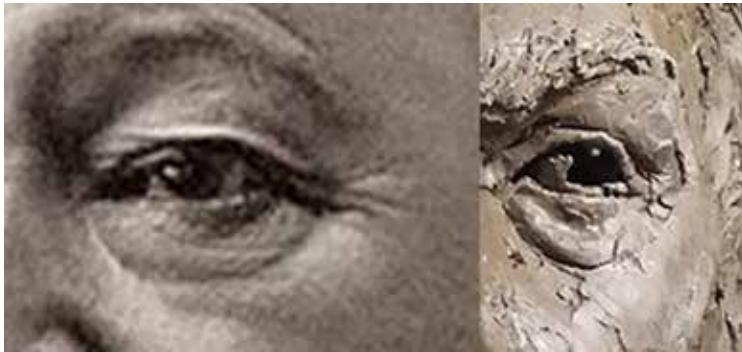
Comparativa del ojo de Sorolla, y del ojo modelado en 2019