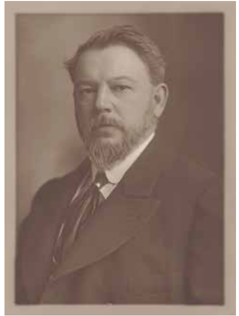
Harris & Ewing. Washington.1909. Museo Sorolla.

Además de las fotografías, y como dato curioso, la figura de Sorolla trascendió a tales niveles de la vida de nuestro país, que grabados sobre su efigie fueron realizados para la estampación en billetes de curso legal, por la Fábrica de Moneda.