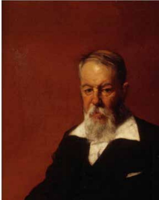
MANUEL BENEDITO (1875-1973). Retrato de Sorolla, ¿1919?.