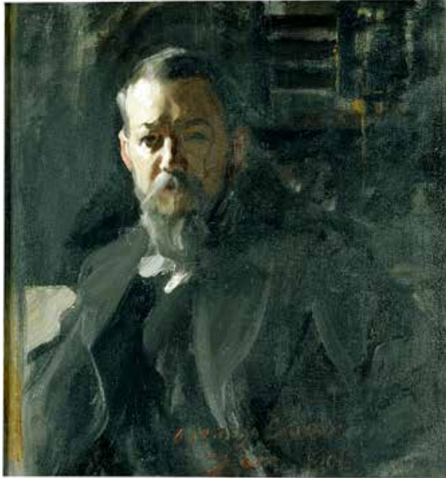
ANDERS LEONARD ZORN (1860-1920).Retrato de Sorolla, 1906.