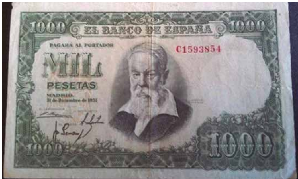
Retratos De Los Grabadores De La Casa De Moneda Y Timbre, Plasmado En Varios Billetes.