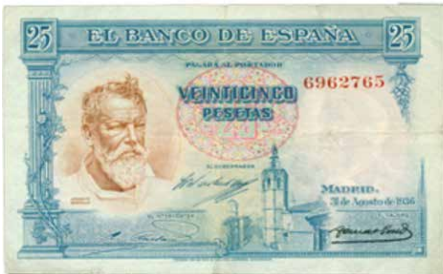
Retratos De Los Grabadores De La Casa De Moneda Y Timbre, Plasmado En Varios Billetes.

Además de las fotografías, y como dato curioso, la figura de Sorolla trascendió a tales niveles de la vida de nuestro país, que grabados sobre su efigie fueron realizados para la estampación en billetes de curso legal, por la Fábrica de Moneda.