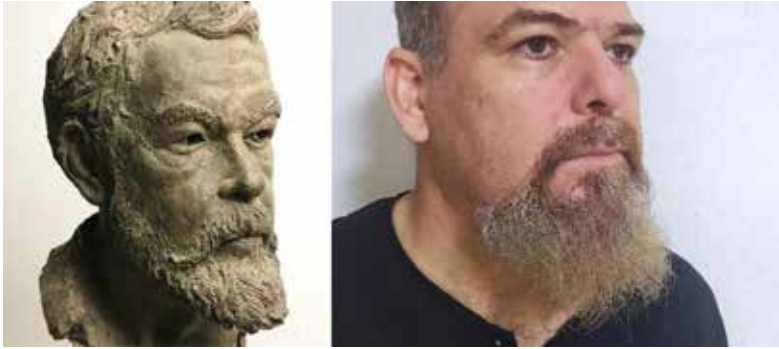
Comparativa de la barba del monumento de 1999, con un ejemplo de barba natural.