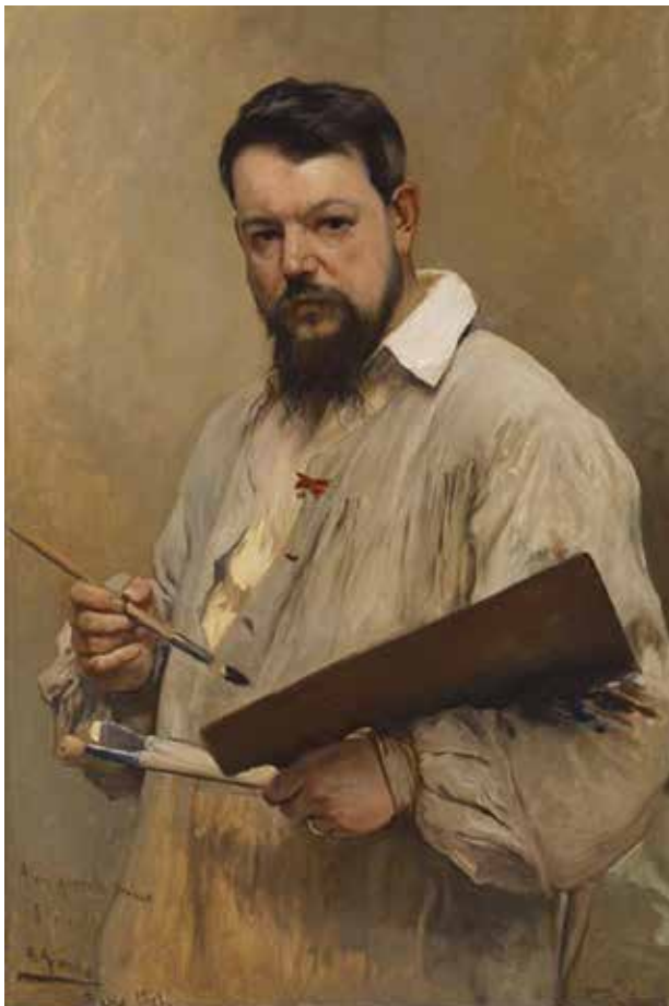
JOSÉ JIMÉNEZ ARANDA "El pintor Joaquín Sorolla", 1901. Museo del Prado