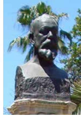
JOSÉ CAPUZ MAMANO (1884 – 1964). Monumento en Sevilla. Jardines de las Delicias en el año 1924