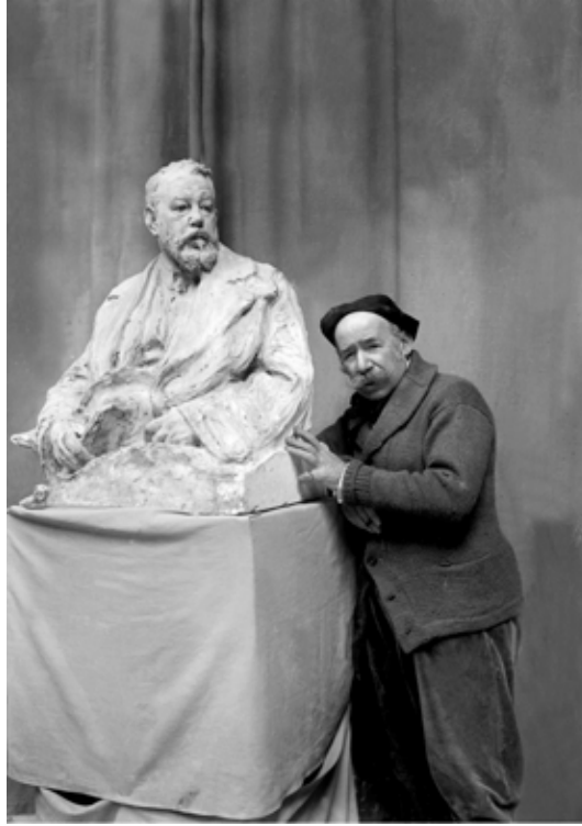
MARIANO BENLLIURE. Copia del Monumento a Sorolla de 1933.