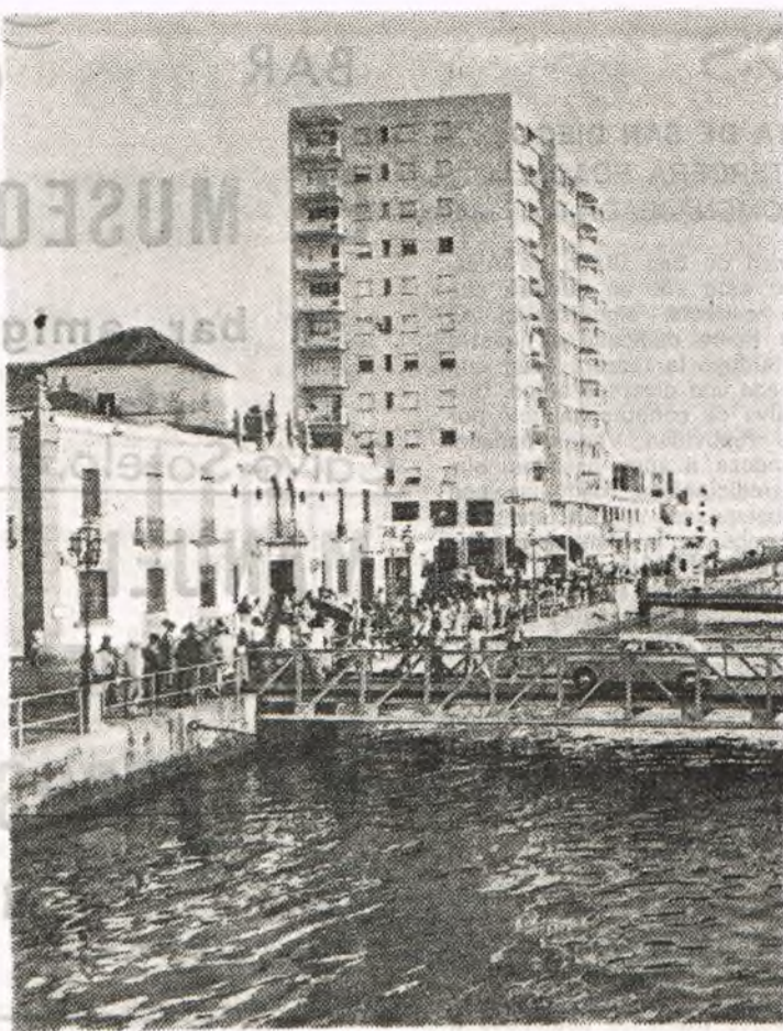
Edificio «Puerta España», ejemplo de lo que nunca debe hacerse en un pueblo.