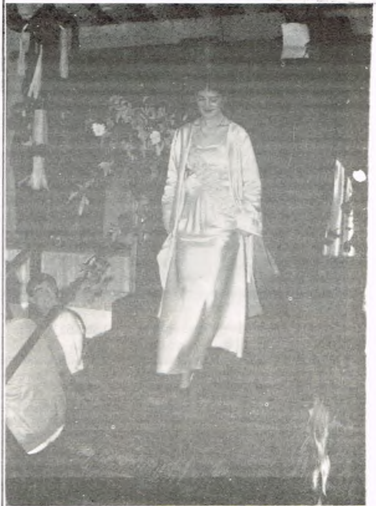
ELECCION DE UNA REINA

El pasado 14 de Febrero tuvo lugar en la Caseta del Carnaval, la elección de la reina para las fiestas del presente año.