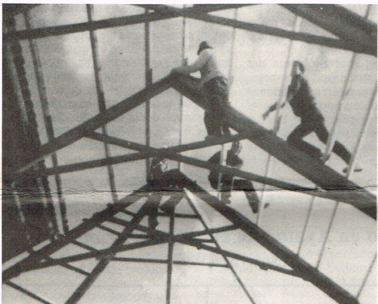
Los vecinos del Campo de Canela reparando la capilla.

Desde principios de octubre de 1979, un grupo de vecinos de Canela se han comprometido a poner un nuevo techo a la Parroquia de Nuestra Señora del Carmen, a pintarla y embellecerla.