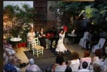
Tasca "La Puerta Ancha". Plaza de la Laguna, 14.. Ayamonte (Huelva)