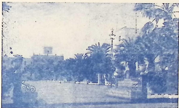
Paseo del General Queipo de Llano