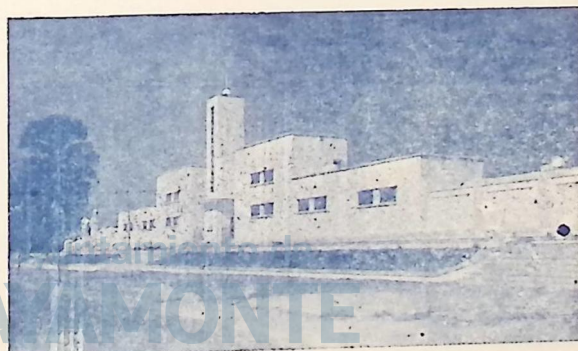
Estadio Municipal Fachada principal