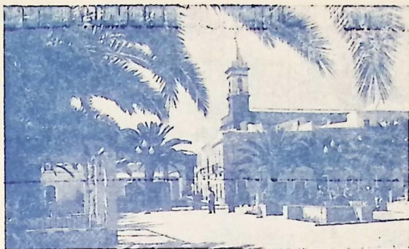
Plaza José Antonio