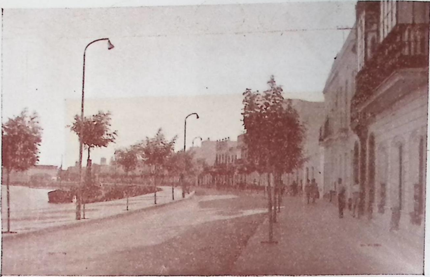
Avenida General Franco