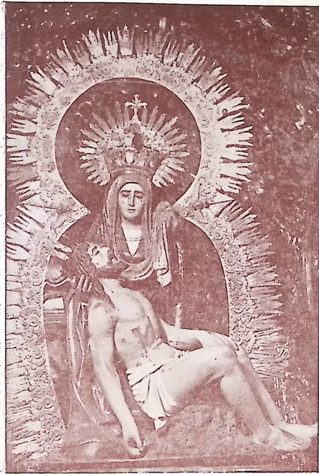
Nuestra Señora de las Angustias Patrona de la Ciudad.