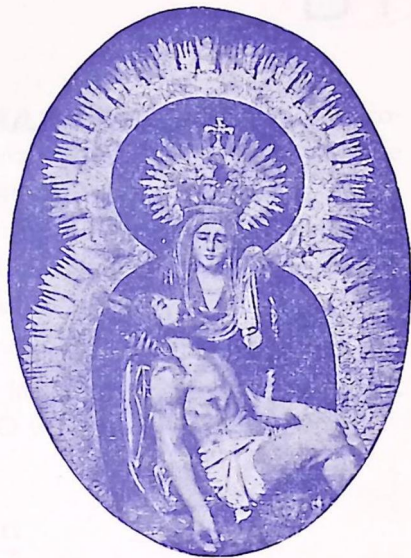
Nuestra Señora de las Angustias Patrona de la Ciudad